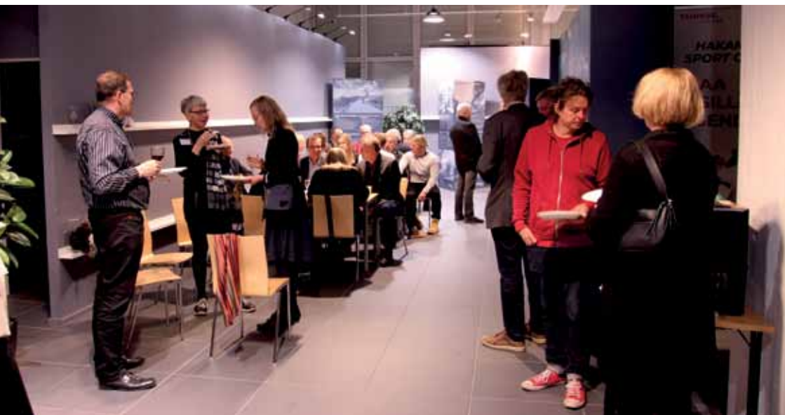
PIRA-päivän cocktail-tilaisuuden tunnelmia.