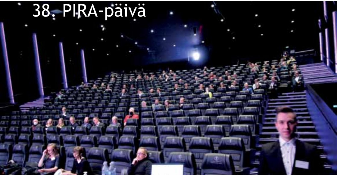
Sali täyttyvässä PIRA-päivässä. Oikella juontaja Kasmir Jolma.