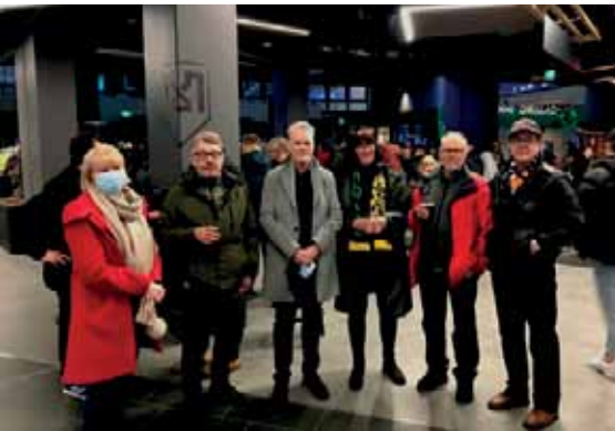
Ennen peliä ala-aulassa.

Sitten alkoi kiipeäminen ylös piippuhylylle. Ennen matsia esitettiin näyttävä valo- ja äänishow. Omakotitalon kokoinen infokuutio katonrajassa oli osana spektaakkelia. Zambonien pyörähdettyä jäällä saapuivat