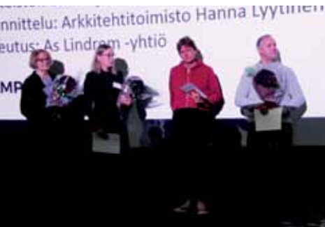
Hyvästä rakentamisesta palkitut henkilöt ja kohteet.