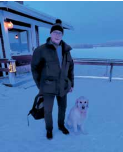
‘Junantuoma’ ja saunavahtikoira Prinsessa Leia.

Jokainen yjb- matka pitää sisälleen aina myös jotakin uutta. Tänä vuonna matka Kolarin asemalta majoille ja koko neljän päivän ajan taittui aseman läheltä vuokratulla suksiboksilla