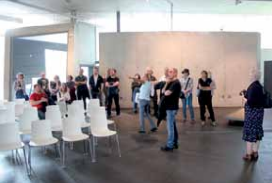
Yllä: Vitra Design Museum, Frank Gehry Keskellä: VitraHaus detaljeja, Herzog & de Meuron Alla: Paloasema, Zaha Hadid

SANAA...) monipuoliseen arkkitehtuuriin. Varsinaisen tuotantoalueen ulkopuoliseen osaan alueesta oli mahdollista tutustua myös omatoimisesti, mm.