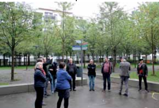
Siedlung Klee sisäpihalla

Osuuskuntarakentaminen on Sveitsissä hyvin yleistä ja aluksi kävimme tutustumassa erääseen sellaiseen hankkeeseen. Siedlung Klee on yksi vuosikymmenen alussa valmistunut hyvä esimerkki, jossa kilpailutuksen seurauksena syntynyt pääosin 7-kerroksinen rakennuskokonaisuus polveilee ympäri koko korttelin muodostaen suojaisan ja toiminnallisen sisäpihan.