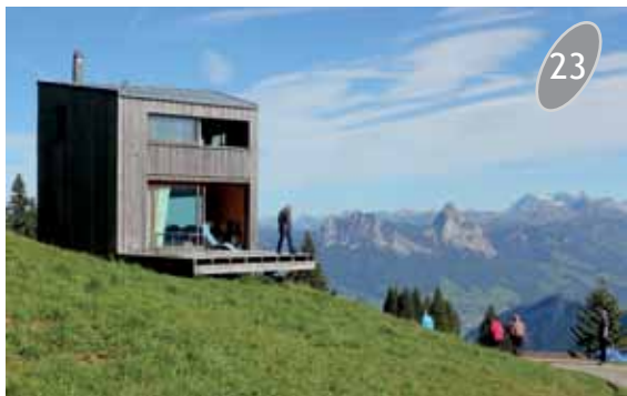
Arkkitehti 'mökkinsä' terassilla.

yhdeksi huipulle, Rigi Scheideggiin. Yli 1 600 metrin korkeudesta oli mahtavat näkymät joka suuntaan. Kävelimme vuoren toista rinnettä alaspäin katsomaan yksityistä vuoristohuvilaa, jonka oli itselleen suunnitellut