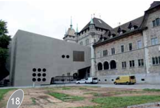
Kaupunginmuseo, vasemmalla laajennusosa.

Hotellilta lähdettiin virkistäytymistauon jälkeen kävelylle kaupunkia halkovan Limmat-joen toiselle rannalle ja tutustumaan Sveitsin Kansallismuseoon ja sen vuonna 2015 valmistuneeseen laajennusosaan. Ulkopuolisen arkkitehtuurikatselmuksen jälkeen menimme myös tutustumaan museon näyttelyihin.