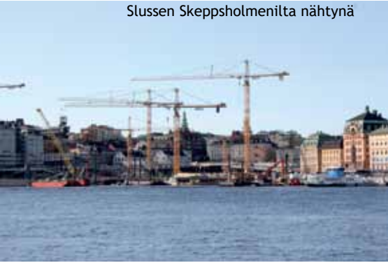
Slussen Skeppsholmenilta nähtynä

vyyksistä ensimmäinen on matkustajakotina toimiva vanha purjealus Af Chapman. Viereisellä laiturilla oli mukava lepuuttaa jalkojaan ja ottaa ryhmäkuvia.