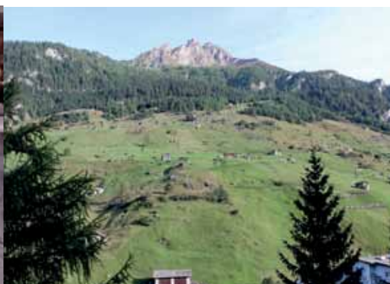
Tätä näytti hotellin parvekkeelta.

Ennen konserttia ehdittiin kuitenkin käydä myös paikallisessa ravintolassa syömässä ja muutama meistä hyödynsi siinä välissä hotellin Mercedes GLA:n vapaa- ta käyttöä hotellivieraille (polttoaine piti itse maksaa). Käytiin laakson toisessa päässä maimia katselemassa. Sitten konserttiin kylpylään ja kannattihan se. Aiemmin kylpylässä lutatessa kävi mielessä, mistä sille konsertille mahtaa tilaa löytyä, mutta kylpylän päällä oli tyhjennetty konserttia varten. Soittajat altaassa ja yleisö portailla. Akus-