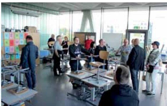
Luokassa ja liikuntahallissa.

vaa. Kuusikerroksinen kuutio lasia ja näkyviä teräsrakenteita on myös sisätiloiltaan normaalisti poikkeava, koska koulussa ei ole käytäviä. Kaikki luokkatilat avautuvat avaraan porrashuoneeseen, jossa on laajat oleskelutilat ja toisaalta joka luokasta on myös pääsy rakennusta kerroksittain kiertäville parveketoisille. Lasijulkisivut on riiputettu välipohjarakenteesta. Koulun ruokala on pohjakerroksessa ja viidennestä kerroksesta löytyy muita yhteisiä tiloja, kuten auditorio ja kirjasto. Mielenkiintoinen on myös kuudes kerros, jossa on kokonaan lasiseinäinen liikuntahalli. Ulkopuolisen iltaikäytön vaatimat kulkuyhteyseratkaisut ovat nekin kuulemma vaatineet pientä mietintää.