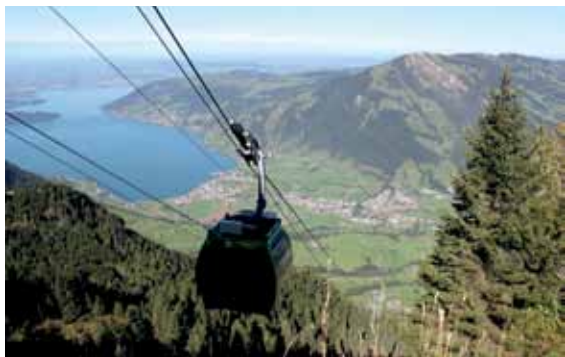
Oikea ympäristö köysiradalle.

Sitten ajeltiin Luzernin itäpuolelle Rigi-vuorelle. Bussilla päästiin köysiradan ala-asemalle Kräbeliin ja siitä noustiin köysiradalla noin 900 metriä Rigin