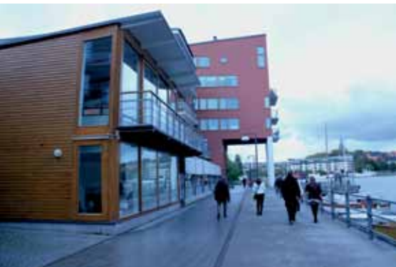
Uutta Luman aluetta

ressa tehtaassa, josta oli vain vähän jäljellä. Luma Brygga on