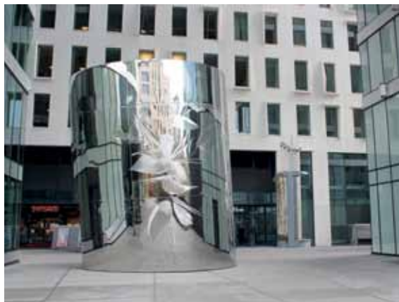
Barcode:n alueella oli näyttäviä pilvenpiirtäjiä ja julkisia taideteoksia.