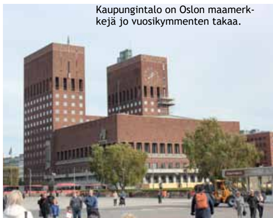
Kaupungintalo on Oslon maamerkkejä jo vuosikymmenten takaa.

Hotelli ansaitsee erikoiskiitokset. Se oli avattu kolme viikkoa aiemmin, saneerattuna vanhaan toimistorakennukseen. Hotelli oli edullinen ja siellä oli minimalistisesti ja laadukkaan kodikkaasti sisustetut pienet huoneet. Yksi seinä oli ikkunaa, toisella oli valokuvatapeetti vanhasta katukuvasta autoineen. Hotellin omistajalla oli Norjan laajin autojen pienoismallikokoelma