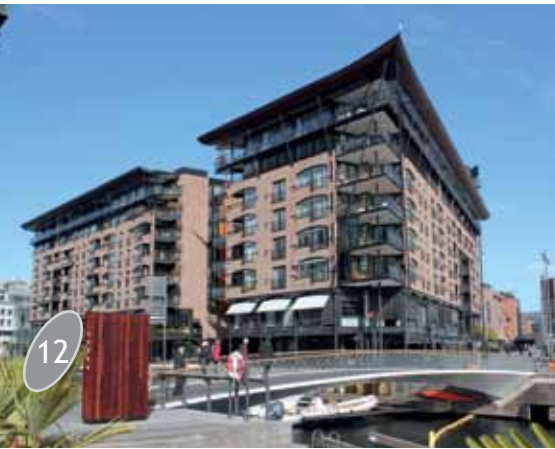
Aker Bryggen näyttävää satama-aluetta.

Seuraavan aamun valjettua aamiaisen jälkeen oli vuorossa ratikkamatka Munch-museoon.