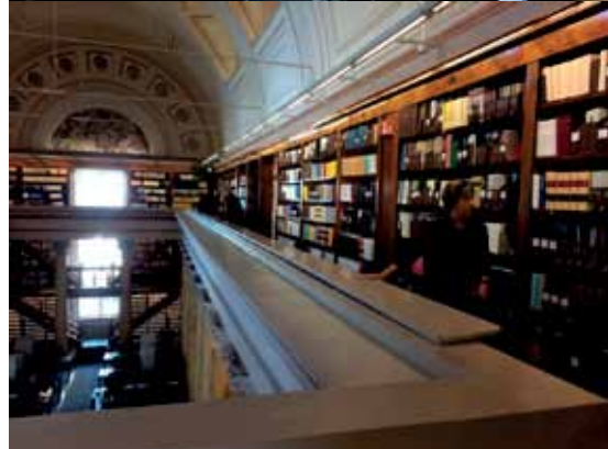
Kansalliskirjastossa historian havinassa.