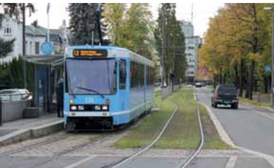
Ratikalla kuljettiin. Mutta kyllä meille tulee modernimpi.

Ensin menimme Vigelandin patjaspuistoon. Ilma oli kauniin aurinkoinen koko matkan ajan.