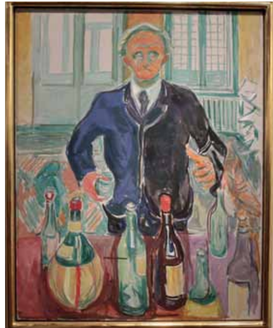
Näköistaidetta turisteista? Myös Munch-museon seinältä.

Norjalaisilla oli syksyinen terasikulttuuri vahvassa toiminnassa. Tuulensuojat, infrapunalämmit-